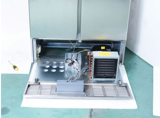
Motore estraibile per un servizio post-vendita più agevole