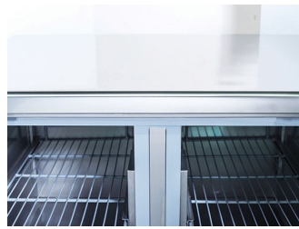
"Thermobrake" anti-condensa sulla cornice interna della porta