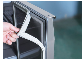
Porta con sagomatura interna per una maggior tenuta termica