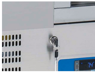
Serratura vano motore di serie