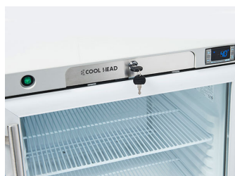
Interuttore generale, termostato digitale e serratura porta di serie