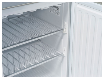
Ripiani evaporatore fissi (3 Ripiani)