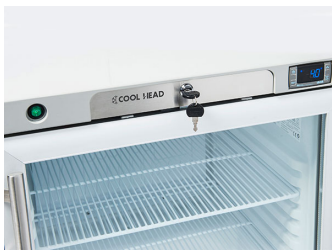
Interuttore generale, termostato digitale e serratura porta di serie