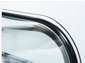
Vetri laterali e frontale curvi