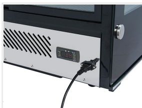
Basamento in acciaio inox con controllore digitale