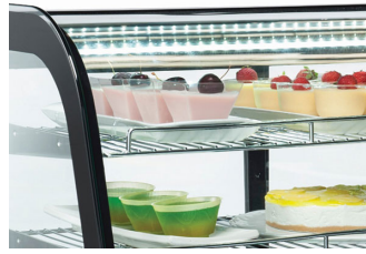
Luce LED interna