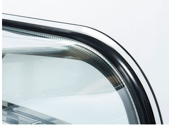
Vetri laterali e frontale curvi