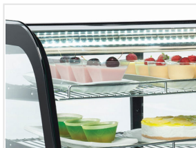
Luce LED interna