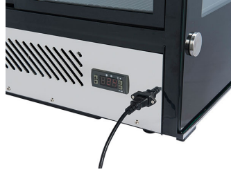
Basamento in acciaio inox con controllore digitale