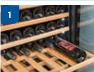
1) Adjustable wooden shelves without stainless steel trim | Ripiani regolabili in legno senza finiture in acciaio