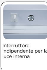
Interruttore indipendente per la luce interna