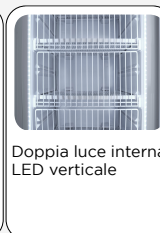
Doppia luce interna LED verticale