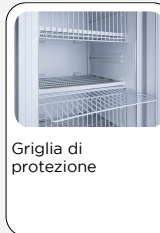
Griglia di protezione