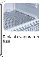
Ripiani evaporatore fissi