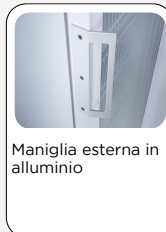
Maniglia esterna in alluminio