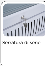
Serratura di serie