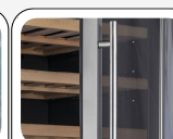
Maniglia cilindrica esterna in acciaio