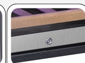
Serratura di serie