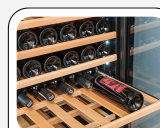
Ripiani in legno scorrevoli