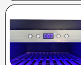
Pannello di comando retroilluminato (Colore Bianco)