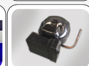
Compressore comandato da Inverter