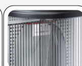
Separatore interno incluso