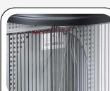
Separatore interno incluso