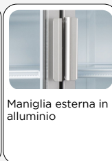
Maniglia esterna in alluminio