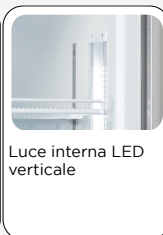
Luce interna LED verticale