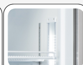
Luce interna LED verticale