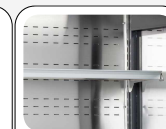
Ripiani in acciaio appoggiati su blocchi ancorati alle spalle