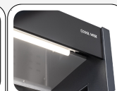
Luce interna LED